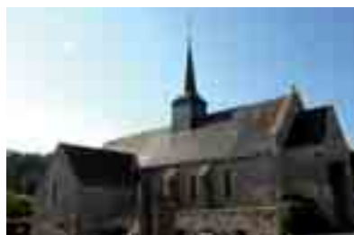
L'église paroissiale St-Martin.

Le nom du village est rattaché à une légende : l'évêque de Tours, Martin (vers 316-397) y aurait fait jaillir de l'eau d'un rocher, avec un bâton, pour baptiser des païens.