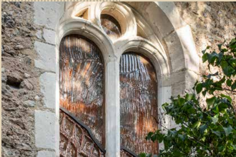
Vitrail de l'église de Flée - Inspiration pour l'atelier