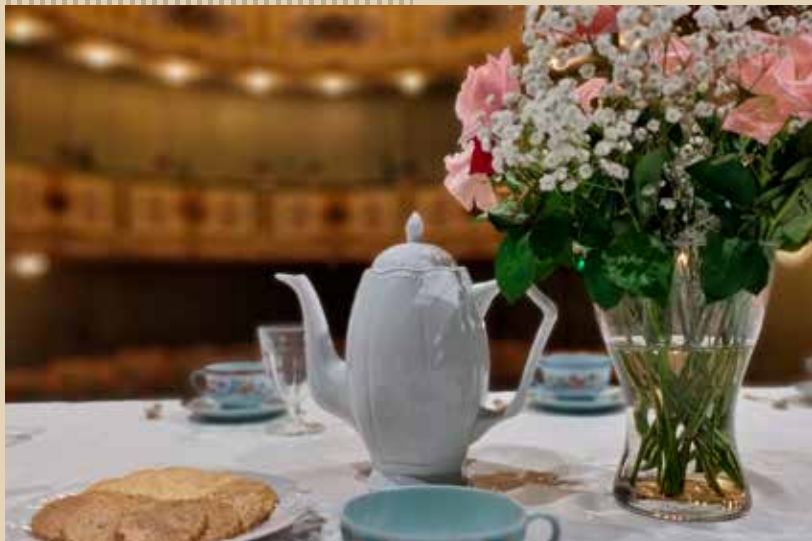
Théâtre de la Halle au Blé, La Flèche