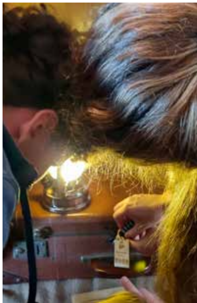
Escape-Game de l'Orient Express