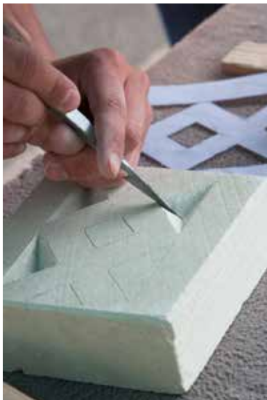
Atelier taille de pierre de tuffeau