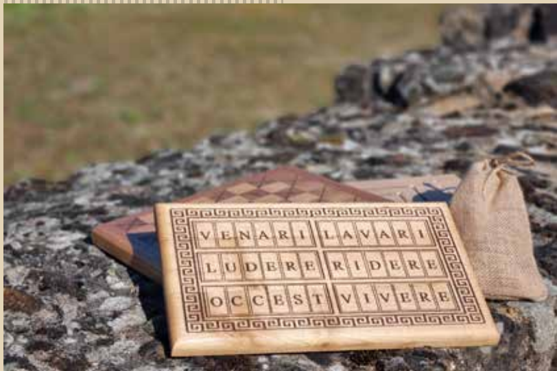
Jeux en bois - Site archéologique de Cherré, Aubigné-Racan