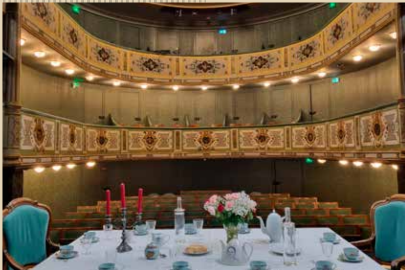
Théâtre de la Halle au Blé, La Flèche