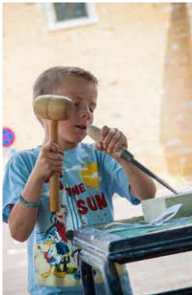
Atelier taille de pierre de tuffeau