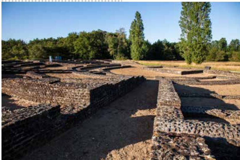
Site archéologique de Cherré à Aubigné-Racan