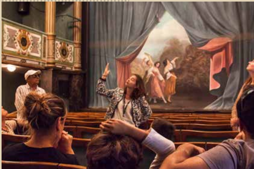
Théâtre de la Halle au Blé, La Flèche