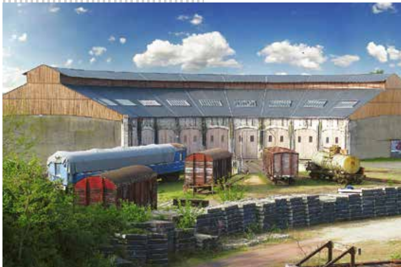
Rotonde ferroviaire de Montabon